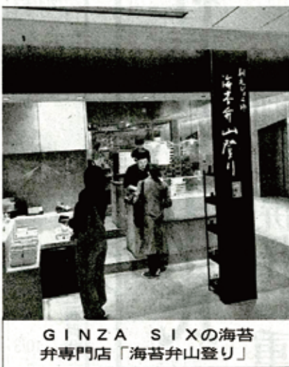
GINZA SIXの海苔井専門店「海苔井山登り」

さは逆に強い発信力を手海苔井専門店の「海苔に入れ、人を魅了する。井山登り」は「登山後スープストックはファに食べる海苔井についていストフードに対して「自ね」が原点。日本航空の