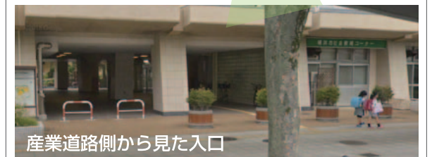
産業道路側から見た入口 J R 京浜東北・根岸線 磯子駅 徒歩4分 ※駐車場はありません。