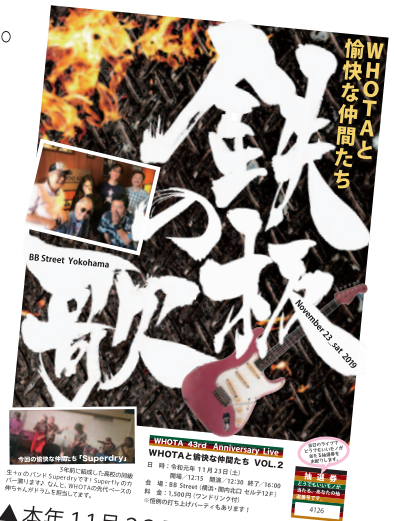
▲本年11月23日開催 WHOTAのライブ告知チラシ

に首をつっこみ、触れ合う居場所があることの大切さに気付かされ...。さらに(前号でご紹介した)